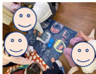
チョークでアート